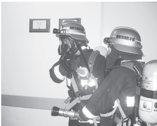
消防隊の消火活動