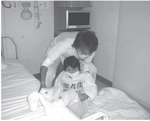
ベッドから安全に素早く下ろします