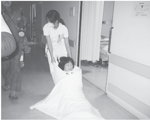
布団にくるみ搬送します