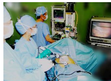
腹腔鏡下手術の様子

ほくろやイボをきれいに取る手術から、腹腔鏡を使用した胆嚢(たんのう)切除術・大腸の切除術、胃の手術をはじめ消化器全般及び乳房などの手術を行なっています。