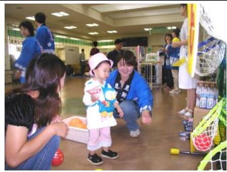
写真は、昨年の様子

タッチパネルを押し、簡単、短時間(5分程度)で脳年齢・ストレス度を測定します。(無料)