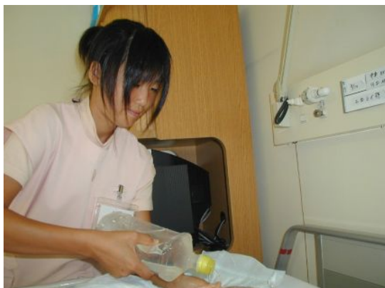
洗髪:あ～、気持ちいい～!(患者さん)

本当に二日間、忙しい中時間をさいていただきありがとうございます。将来は医療関係の仕事につけたら・・・、というよりも絶対になりたいと思いました。二日間学んだことを今日からすぐにも役立てて、一日でも早く夢に近づけたらなと思いました。