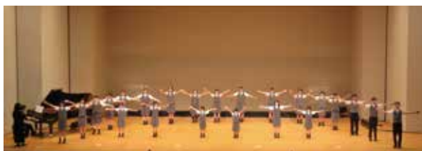
アルカディア少年少女合唱団